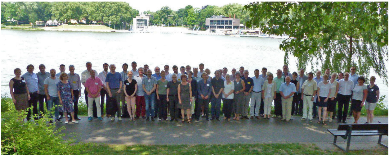
58 Teilnehmende aus Schule, Hochschule und Bildungsadministration diskutierten die „Lücke“

In den intensiven Diskussionen zu den Vorträgen und in den Arbeitsgruppen wurden verschiedene Gründe für die Lücke genannt. Veränderte strukturelle Rahmenbedingungen sind ein Ursachenkomplex. Dazu gehört zum einen die immer größere Heterogenität der Studienanfänger – die Studierendenquote wächst ständig und ist aus vielerlei Gründen aktuell mit über 50% eines Jahrgangs so hoch wie noch nie. Zum anderen werden die deutliche Senkung der Stundenzahlen im Fach Mathematik und die Abschaffung von Leistungskursen in einigen Bundesländern als Probleme genannt. Gerade die Anpassung der Stundenanzahl nach oben wäre sicher ein wichtiger Schritt zur Problemlösung. Dennoch bleibt die Frage nach wei-